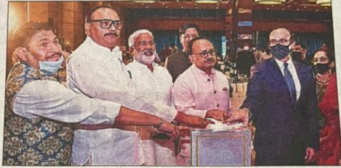
इंडो-अमेरिकन चैम्बर ऑफ कॉमर्स लखनऊ चैप्टर का उद्घाटन शुक्रवार को न्याय एवं विधायी मंत्री ब्रजेश पाठक ने किया।

तिभूति अधिग्रहण कार्यक्रम (जी-प) 2.0 के तहत दो चरणों में 0.000 करोड़ रुपये की राशि