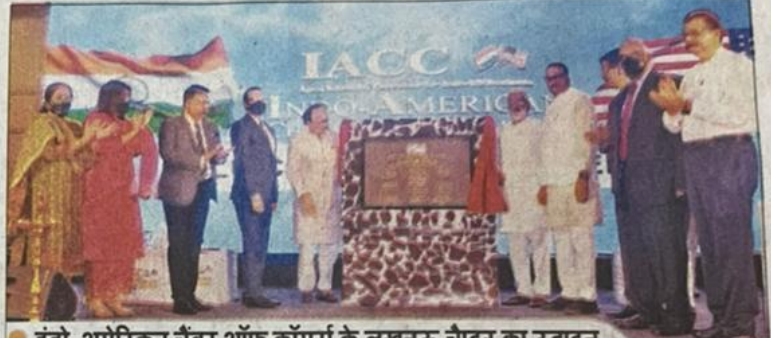
● इंडो-अमेरिकन चैंबर ऑफ कॉमर्स के लखनऊ चैप्टर का उद्घाटन

चैंबर को आगे आना चाहिए कार्यक्रम में मंत्री बृजेश पाठक ने बताया कि प्रदेश में सोलर मैनुफैक्चरिंग यूनिट और इंटीग्रेटेड चिप निर्माण संबंधी इकाइयों की स्थापना के लिए इंडो-अमेरिकन चैंबर को आगे आना चाहिए. भाजपा